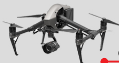
Droni (operatori certificati ENAC)